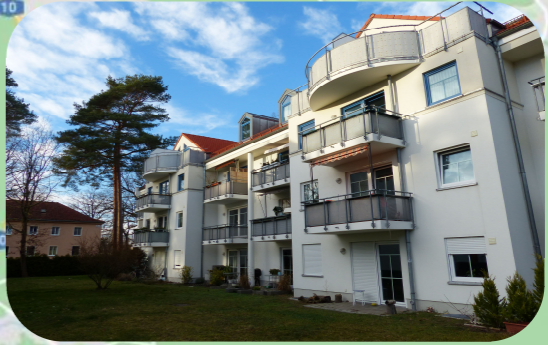
Waldpromenade 6-8 in Erkner