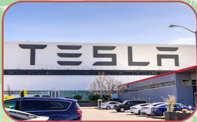
Entfernung zur Waldpromenade 8 km ~ 10 Min. (Auto)