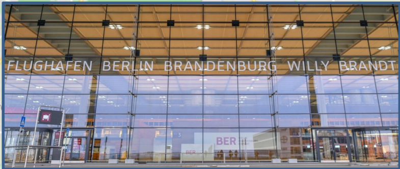
Entfernung zur Waldpromenade 31 km ~ 40 Min. (Auto)