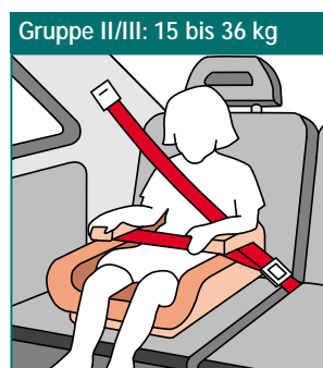
Sitzerhöhung ohne Schlafstütze