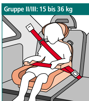
Sitzerhöhung mit Schlafstütze